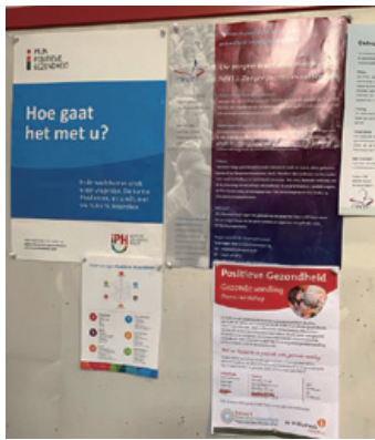
診療所の壁に貼られたポジティブヘルスのポスター